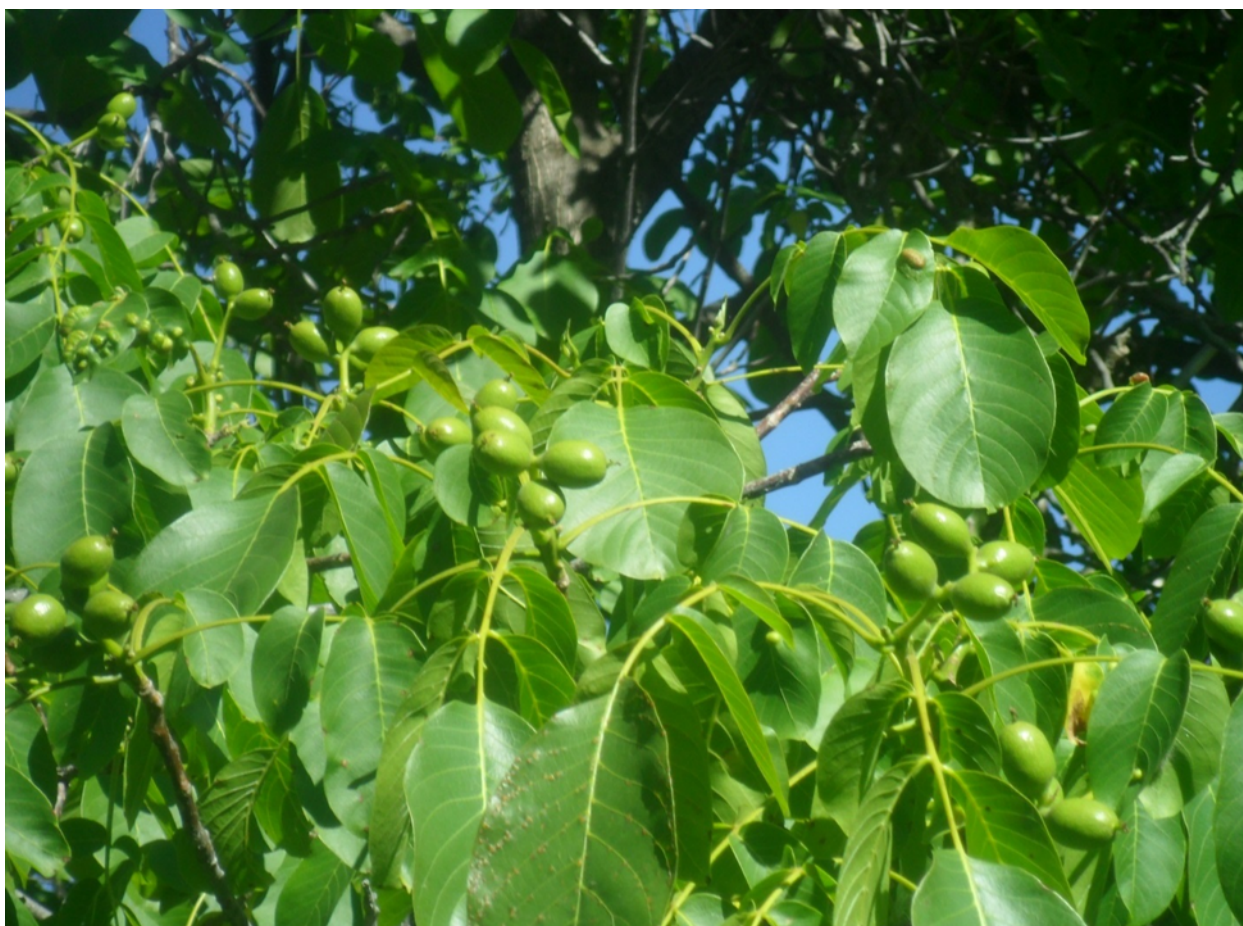
Рис. 1. Обильное плодоношение ореха грецкого в урочище Бору-Корбос, ГПЗ «Дашман», осень 2023 г. Source?

Нами при учёте естественного возобновления использовался метод закладки трансект размером 1X4, 1X2 в зависимости от площади опытного участка. Трансекты закладывались по диагонали и на них проводился сплошной перечёт всех древесно-кустарниковых пород по разрядам высот с последующим переводом на 1 га.