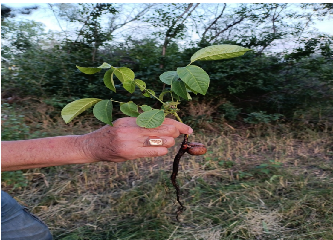
Рис 3. Сеянцы из семян Juglans regia , в дикой природе Source?

Пробная площадь №2. Насаждения ореха грецкого ( Juglans regia L.), естественного происхождения. Площадь участка 1,0 га. Опытный участок находится внутри ограждения, 1800 метров над уровнем моря. По типу относится к орешнику коротконожковому крутых склонов. Почвы чёрно-коричневые. Состав насаждений преобладают приспевающие и спелые деревья ореха, единично встречаются: яблоня Сиверса ( Málus sievérsii ) боярышник туркестанский ( Crataegus turkestanica ), алыча согдийская ( Prunus sogdiana ), клён туркестанский ( Acer turkestanicum ) и др. В травянистой растительности в большинстве коротконожка лесная ( Brachypodium sylvaticum ), единично недотрога мелкоцветковая ( Impatiens parviflora ), крапива двудомная ( Urtica dioica ). При подсчёте на пробной площади насчитывается возобновление однолетних подростов ореха грецкого - 78 шт./га.